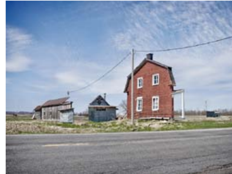
Zacharie Gaudrillot-Roy - Facades